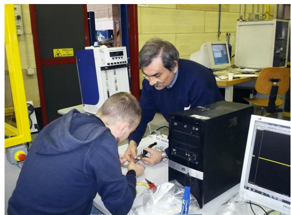
Fot. 2 Konfiguracja systemu

Aby zwiększyć dokładność testu Politechnika w Mediolanie chciała opracować cyfrowy system akwizycji danych zdolny do wysokiej częstotliwości próbkowania , który mógłby wykryć sygnały impulsowe powstałe podczas zderzenia między wahadłem Charpy'ego, a próbką. Digitalizacja wahadła Charpy'ego - określona przez UNI EN ISO 14556 - wymaga systemu tensometrycznego zamontowanego na mechanizmie uwalniania i systemu pobierania próbek o przepustowości