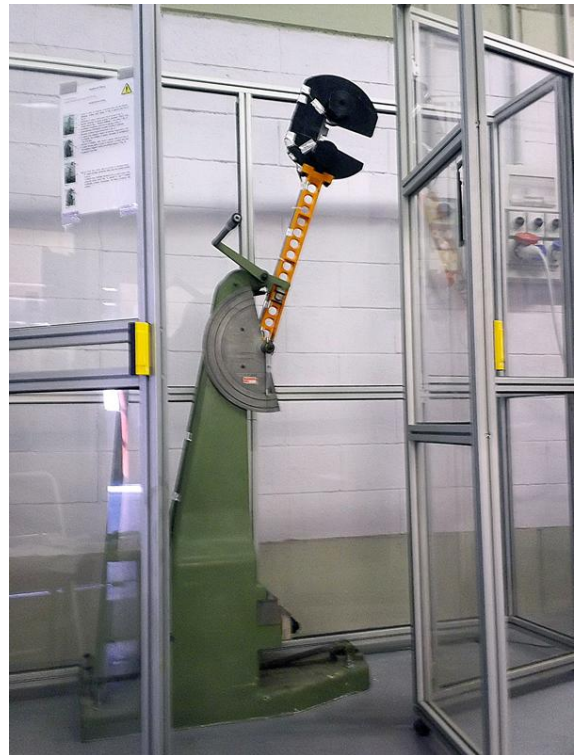
Fot. 3 Wahadło w testach udarowych Charpy'ego

Dodatkowe sygnały można jednocześnie uzyskać przez cztery kanały , a mostek łatwo zrównoważyć za pomocą zainstalowanych rezystorów w układzie. Oprogramowanie Perception firmy HBM oferuje intuicyjny interfejs, który prowadzi naukowców przez optymalną konfigurację wszystkich parametrów. To znacznie zmniejsza ryzyko wystąpienia błędów spowodowanych przez niewłaściwą konfigurację eksperymentu.